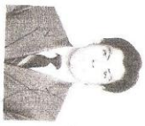
PROFESOR SERENIANO GENERAL